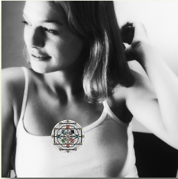
Zona 2: centro dello sterno