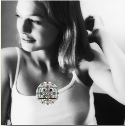
Zone 2: Mitte des Brustbeins