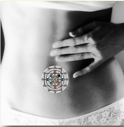
Zone 1: Navel