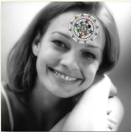
Zona 3: centro della fronte