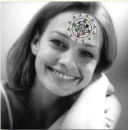
Zone 3: Middle of the forehead