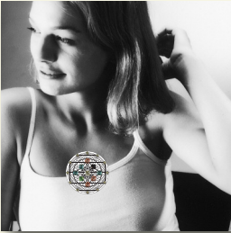
Zone 2: Middle of the breastbone